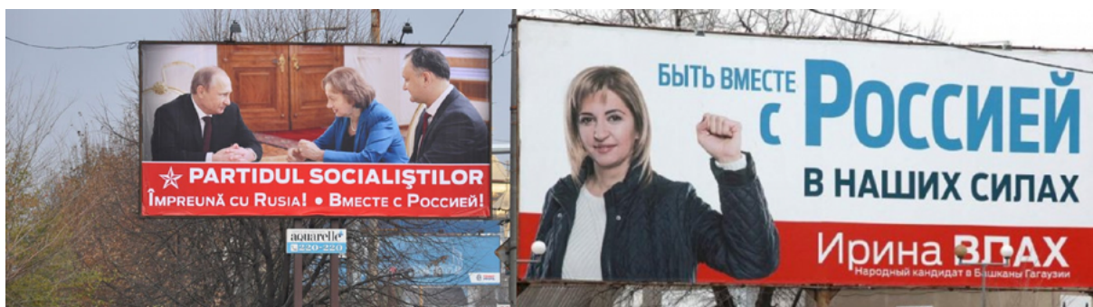
Изображение 1. Агитационный баннер, 2014

Символическим выражением общественного возмущения стала реплика депутата Народного собрания Гагаузии Ивана Бургуджи, заявившего : «С такой поддержкой со стороны России в Гагаузии выиграла бы даже кукла Барби». В результате Парламент Республики Молдова в апреле 2015 года принял поправку к Избирательному кодексу , запрещающую избирательным конкурентам «вовлекать каким-либо образом лиц, не являющихся гражданами Республики Молдова, в агитационные действия».