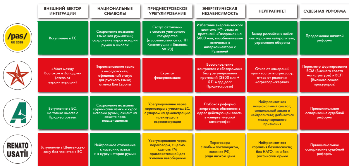
Таблица 5. Матрица позиций по спорным вопросам

Отношение основных политических партий к шести ключевым спорным вопросам, изложенное выше, позволяет в синтетической и визуальной форме (по принципу «светофора») отразить совместимость между партиями для возможного формирования послевыборных альянсов.